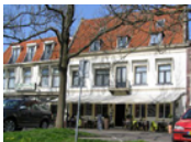
Hotel Restaurant Die Port van Cleve *** (Enkhuizen)