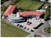
Fletcher Duinhotel Burgh Haamstede **** (Burgh Haamstede)

Bij het selecteren van de hotels proberen wij zo veel mogelijk rekening te houden met een veilige afgesloten fietsenstalling. Echter kunnen we dit niet bij alle hotels garanderen en is dit mede afhankelijk van het aantal fietsen van andere hotelgasten.